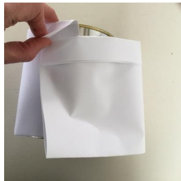
Ene bovenrand in andere bovenrand schuiven