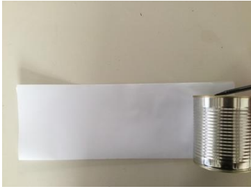
Aftekenen bovenkant blik