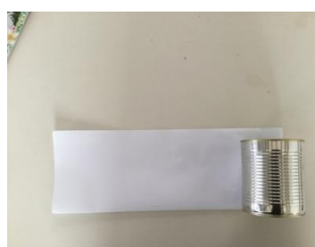
Blik erop (blik onderkant papier)