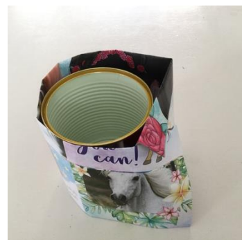
bovenrandjes in elkaar