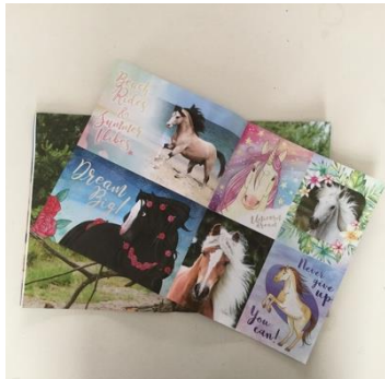
Poster uit tijdschrift halen