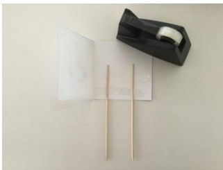
De prikkers vast plakken met plakband