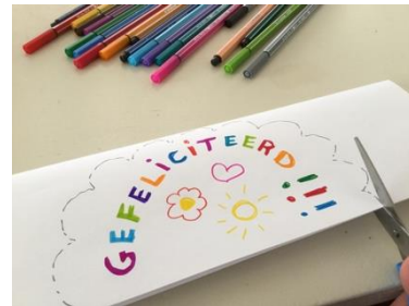
Knip om jouw tekst, tekening heen