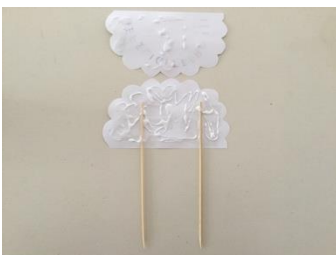
Lijm er op