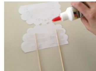
prikkers vastplakken met plakband