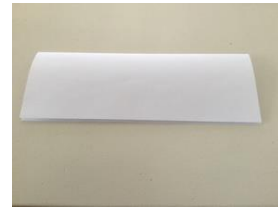
open kant naar je toe