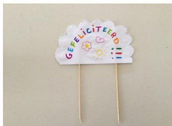
weer dichtklappen, lijm laten opdrogen