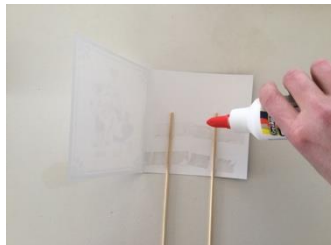
Lijm op de kaart