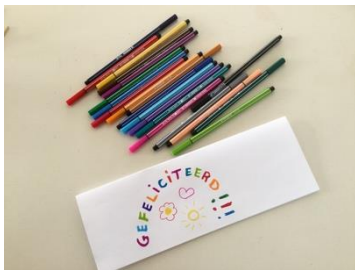
Schrijf, teken er iets op