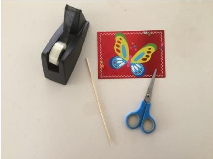
Plakband, kaart, schaar, satéprikker