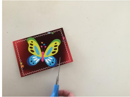
Om het plaatje heen knippen