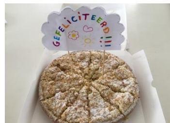
in de taart prikken, KLAAR!