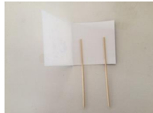
2 satéprikkers erop leggen