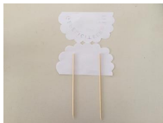
satéprikkers erop leggen