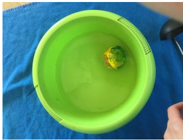
verf eraf wassen, het water kleurt