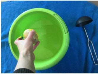
Aardappel in de bak met water