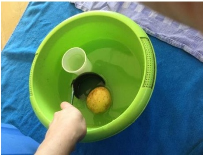
Aardappel met de pollepel eruit vissen