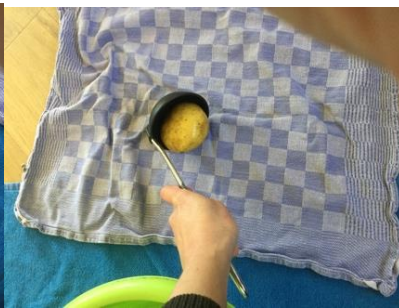
op de theedoek/ handdoek laten rollen