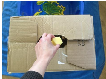
weer in de doos