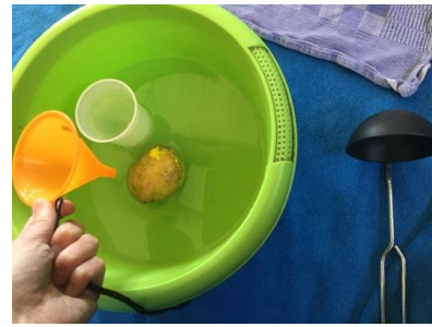
attributen erbij om uit te proberen