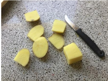
nieuwe vorm van aardappel snijden