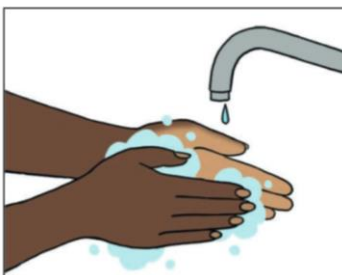
1. Was je handen een paar keer per dag met zeep. Was ook goed tussen je vingers.